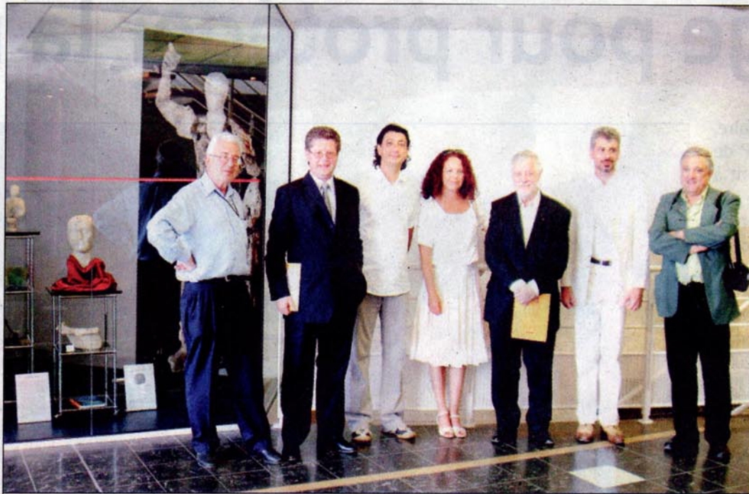
« La Corse dans la Méditerranée » réunit quelques-uns des meilleurs spécialistes de la question pour faire partager au plus grand nombre une part de l'histoire de l'humanité à partir du « laboratoire » insulaire.