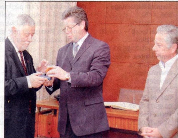
Le maire de Porto-Vecchio, remet la médaille de la ville à Yves Coppens en présence du député et président de l'assemblée de Corse, Camille de Rocca Serra. Le livre d'or de la cité est signé par l'illustre scientifique.